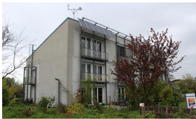
As primeiras Passive Houses em Darmstadt

Durante a conferência foram também apresentadas muitos novos exemplos de Passive House construídas em todo o mundo com destaque para as sessões dedicadas aos exemplos mediterrâneos, da América do Norte e da China. A Homegrid apresentou, na sessão 14, o seu trabalho “The impact of the standby consumption in a Passive House”, em que foi analisado e discutido o peso do consumo eléctrico devido ao standby na primeira Passive House em Portugal e revelado o potencial de poupança da sua mitigação à escala local e global.