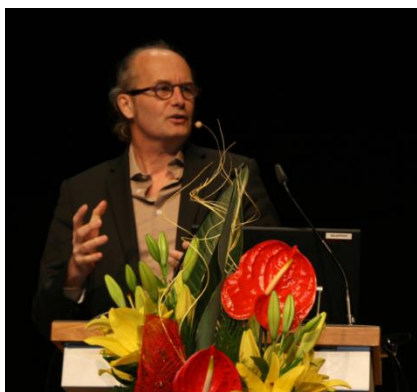
Intervenção de Claude Turmes

Vinte e cinco anos após a construção das primeiras Passive Houses, verifica-se que são edifícios perfeitamente funcionais mantendo desde então um elevado desempenho sob o ponto de vista energético e de qualidade de vida proporcionada aos seus ocupantes. Este trabalho mostra que o conceito Passive House é fiável e verificável e que é a solução ideal para os Edifícios de Balanço Quase Zero ou Nearly Zero Energy Buildings (NZEB) como definido pela União Europeia. Esta foi uma das ideias chave deixada pelo eurodeputado luxemburguês e presidente da EUFORES Claude Turmes, que foi um dos promotores e impulsionadores da Energy Performance of Buildings Directive (EPBD) que estabeleceu a obrigatoriedade dos NZEB já a partir de 2019. Claude Turmes revelou que o espírito da EPBD e dos NZEB assenta na Passive House e na redução drástica das necessidades de energia no parque edificado.