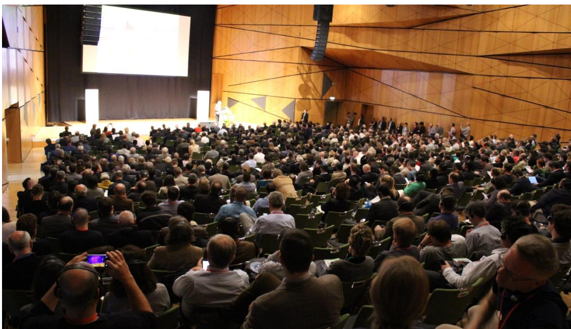
A sessão plenária na conferência

A conferência ficou marcada, nesta sua vigésima edição, pela dupla celebração: os vinte anos do Passivhaus Institut, criado em 1996, e os vinte e cinco anos da construção das Primeiras Passive Houses em Darmstadt em 1991. Nesta conferência estiveram presentes mais de 1000 especialistas mundiais, na sua maioria arquitectos, e esse facto foi realçado por Wolfgang Feist na sessão inicial, que realçou o papel dos arquitectos na implementação de Passive Houses e lançou um repto: terão de ser desenhados edifícios eficientes, atraentes e acessíveis. A mesma ideia foi deixada por Franz Alt, um importante jornalista e ecologista alemão, relevando o papel dos arquitectos na preservação do nosso planeta.